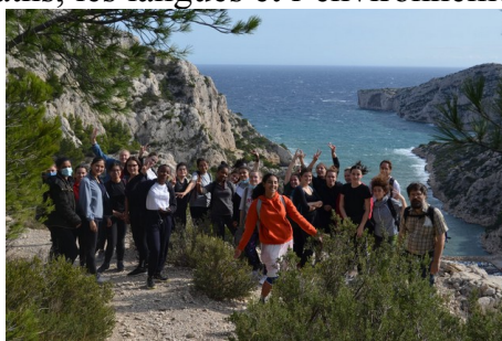
Stage d'une semaine au CIRM pour les filles de première

Elles enrichissent les Curriculum Vitae de nos élèves pour parcoursup , y compris dans un projet ERASMUS MaSuD qui associe les maths, les langues et l'environnement.