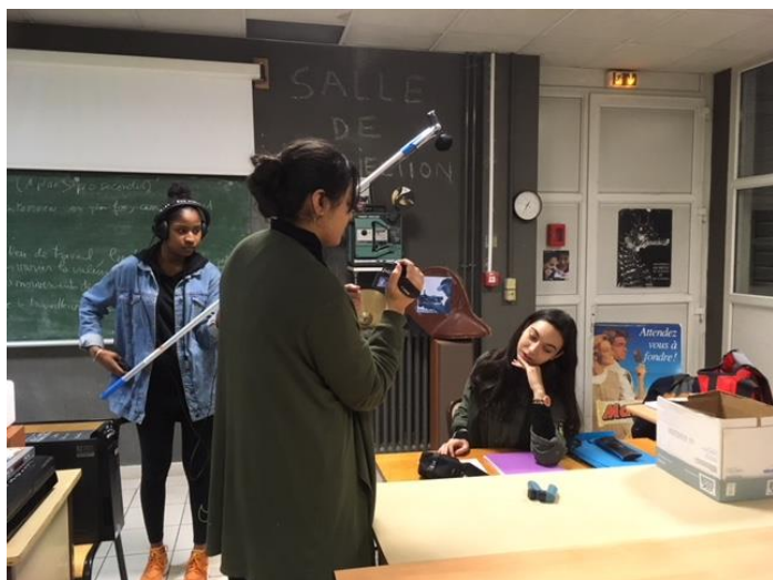
Séance de tournage