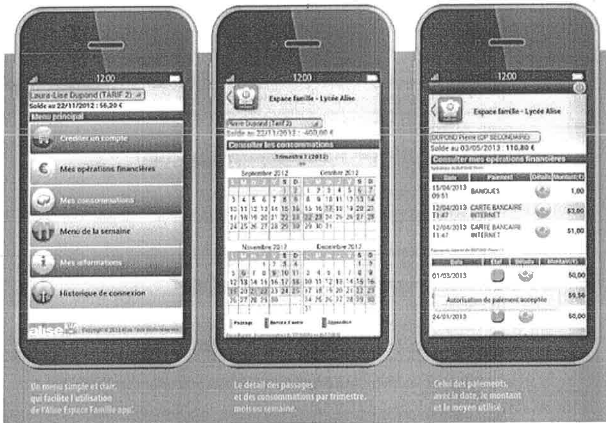
Un menu simple et clair, qui facilite l'utilisation de l'Alise Espace Famille app.

Alise permet aux familles d'accéder très facilement depuis Internet aux informations du compte de l'élève afin de suivre au jour le jour, son solde, ses passages à la demi-pension, ainsi que les transactions financières. La famille aura ainsi un meilleur suivi de la restauration scolaire de son enfant, et pourra à tout moment si nécessaire effectuer un paiement par Internet.