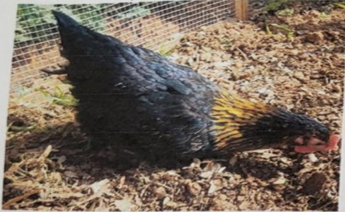
Descartes (42 %)