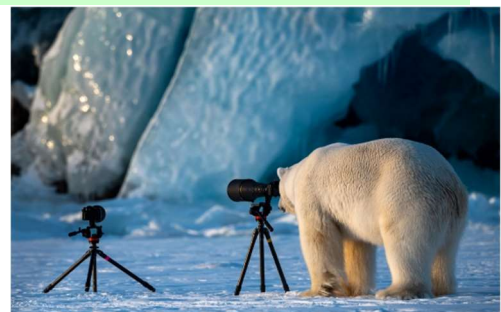
"Polar Bear Changing Careers" de Roie Galitz