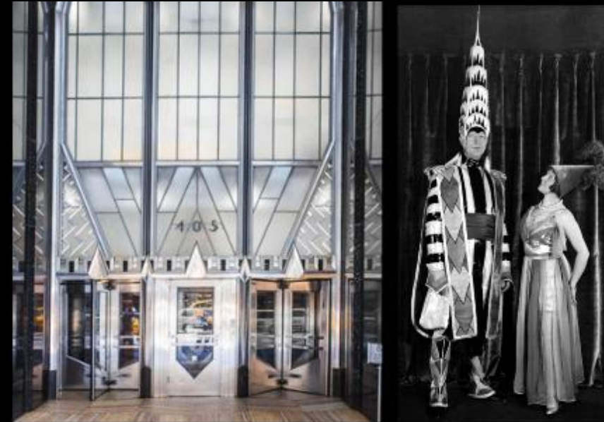
New York : Chrysler Building 1930, William Van Alen.

Par Michel REBOISSON , Historien de l'Art