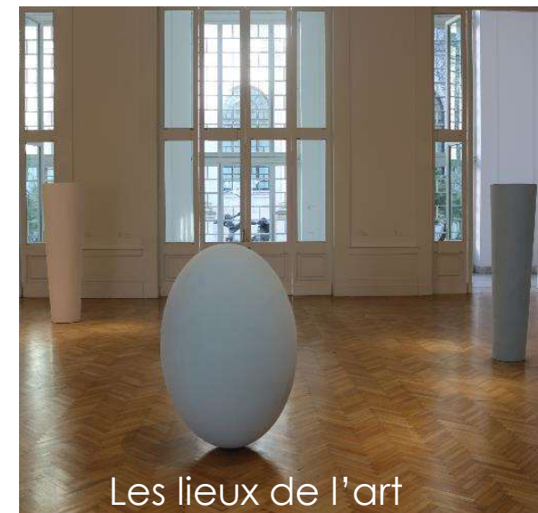
Les lieux de l'art