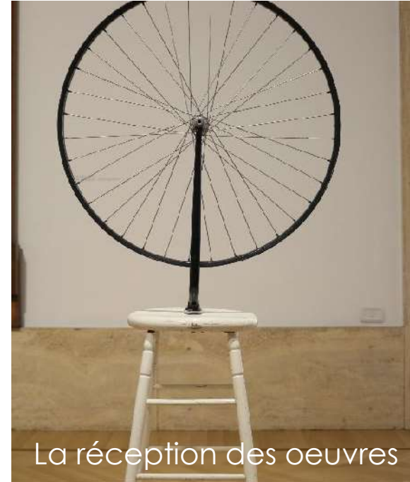
La réception des oeuvres