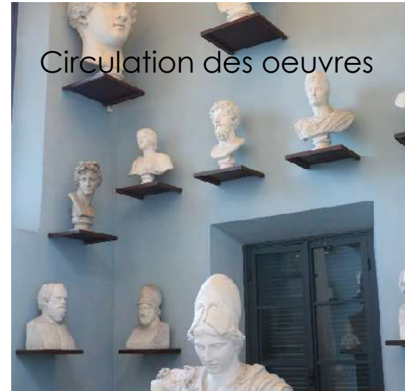
Circulation des oeuvres