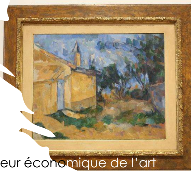
Valeur économique de l'art