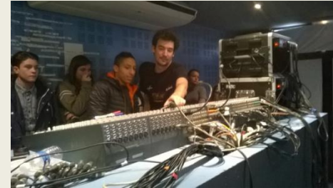
Elèves de seconde qui découvrent la table de mixage, Café Provisoire, Manosque, mars 2018

- questionne la place de la musique et de ses pratiques dans la société contemporaine, la diversité des esthétiques ainsi que les langages et les techniques de la création musicale dans le temps et dans l'espace.