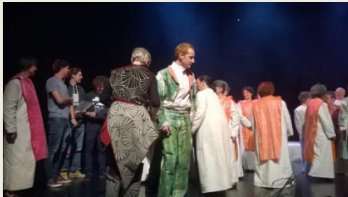
Répétition publique Opéra « La flûte enchantée », décembre 2017

- écoute et analyse des œuvres rattachées aux thématiques