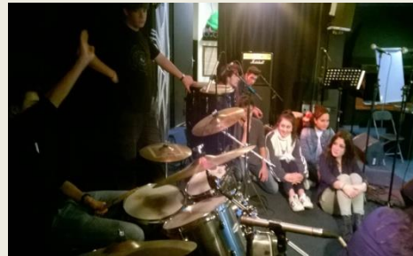
Elève de Première, batteur qui ajuste son niveau de retour scène, janvier 2018