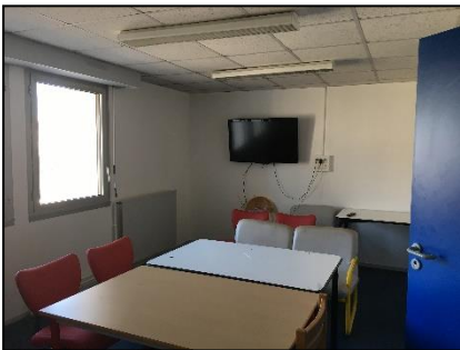
Salle d'études internat

Les internes doivent se munir de toutes leurs affaires nécessaires pendant la journée.