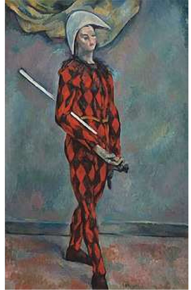
Cézanne, Arlequin , 1888