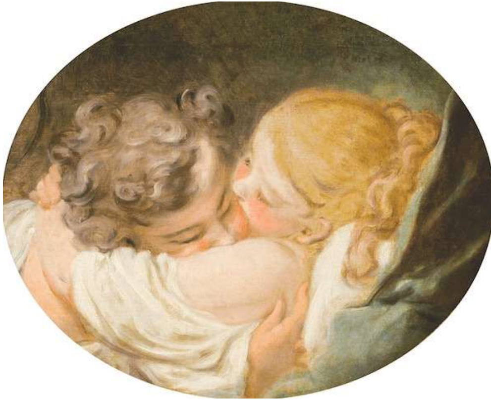
Fragonard, Le baiser (vers 1770)