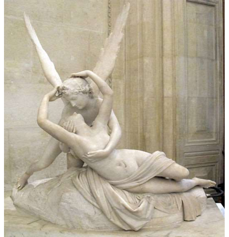
Canova, Amour et Psyché , 1793