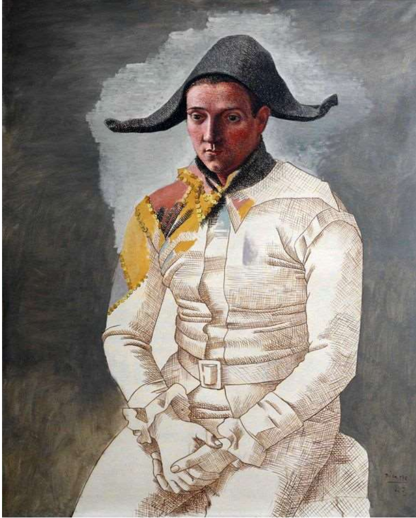
Picasso, Le peintre Salvador en arlequin , 1923