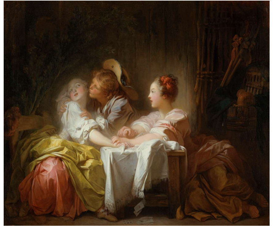
L'Enjeu perdu ou Le Baiser gagné