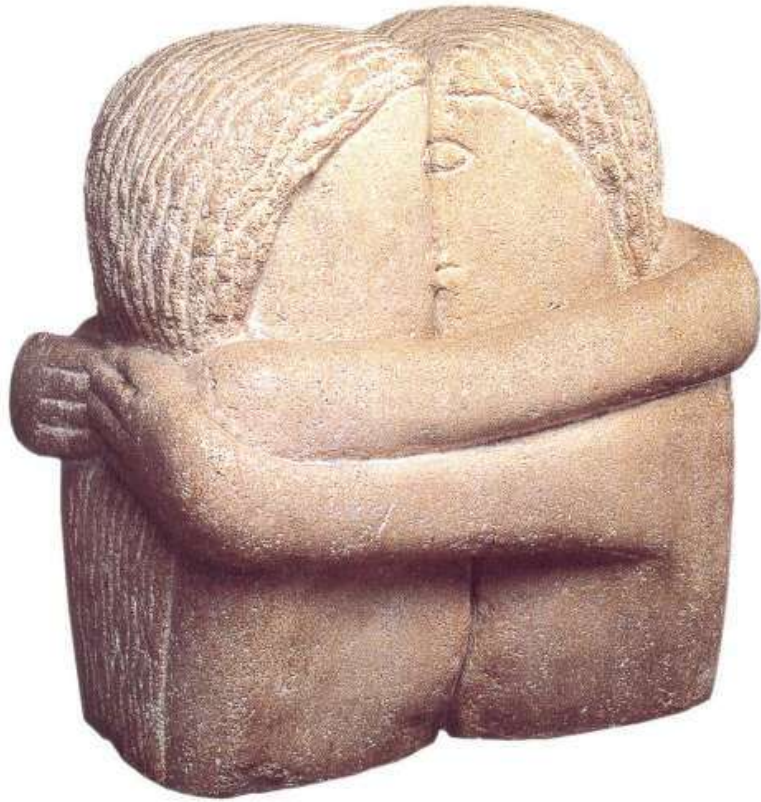
Constantin Brancusi, Le Baiser , 1907-1908