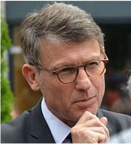
M. Peillon, ministre, félicite les élèves de provençal pour leur spectacle sur Frédéric Mistral.