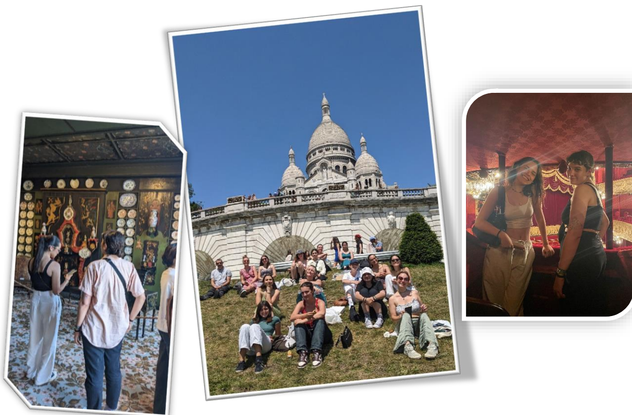
Week-end culturel à Paris (juin 2023)

Le cursus HK/KH est exigeant mais tellement enrichissant. Il est un tremplin pour le reste des études qui paraissent bien plus simples après. L'accès aux écoles notamment l'ENS reste limité mais le bagage culturel et les nombreux entraînements à l'écrit et à l'oral font de nous des étudiants performants dans le reste de nos études. J'ai pu y apprendre à travailler et rien n'est plus important pour la poursuite des études.