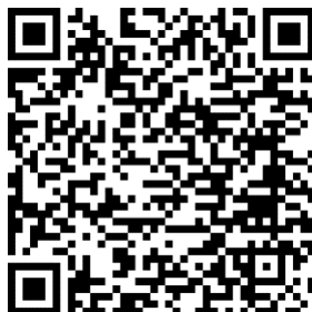
QR Code et lien pour My Maps GA

2- ou utiliser le lien ci-dessous (faites un copier/coller sur votre navigateur Internet)