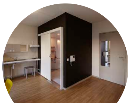
Un studio handicap* Cité U Les Gazelles (Aix-en-Provence)