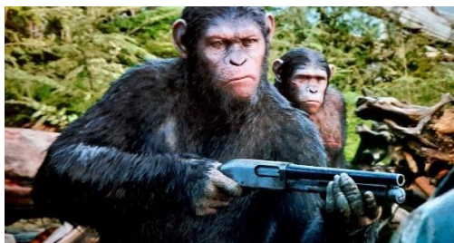
Les représentations du monde : l'homme et l'animal : La Planète des singes, l'Affrontement , de Matt Reeves, 2014