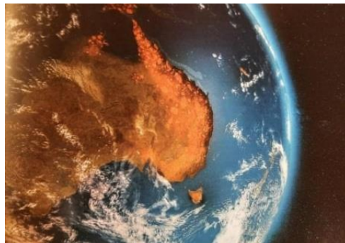
Sur le thème de l'humanité et ses limites, image satellite des gigantesques incendies en Australie...