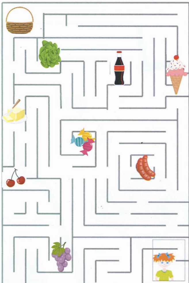
Aide Nina à rejoindre le panier avec les 3 aliments non sucrés (sans jamais passer par les aliments sucrés)