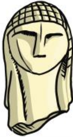
Dame de Brassempouy, une statuette en ivoire est la plus ancienne représentation de visage humaine (-21 000)

L'Homme de Cro-Magnon est un nom utilisé pour désigner les homo sapiens installés en Europe entre 40 000 et 10 000 ans avant notre ère.