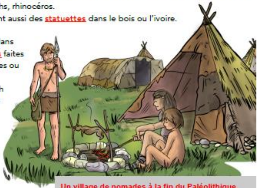
Un village de nomades à la fin du Paléolithique.

Ils vivent dans des huttes faites de branches ou d'os de mammouth recouverts de peaux.