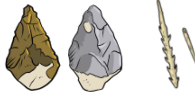
Bifaces en silex, harpon et aiguille en os

L'invention de l'aiguille va leur permettre de coudre des vêtements qui leur permettront de résister au grand froid qui règne sur l'Europe à cette époque.