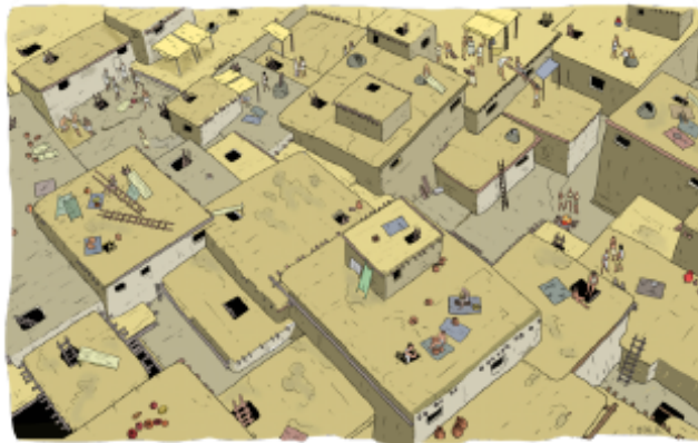
Il y a 9 000 ans Çatal Höyük en Anatolie (Turquie)

À son apogée, elle compte 5 000 habitants (ce qui est considérable à l'époque). Elle fait du commerce avec d'autres contrées lointaines et développe un artisanat de qualité. Elle recèle des sanctuaires avec des peintures murales, des figurines et des sépultures, témoignant d'une vie religieuse complexe.