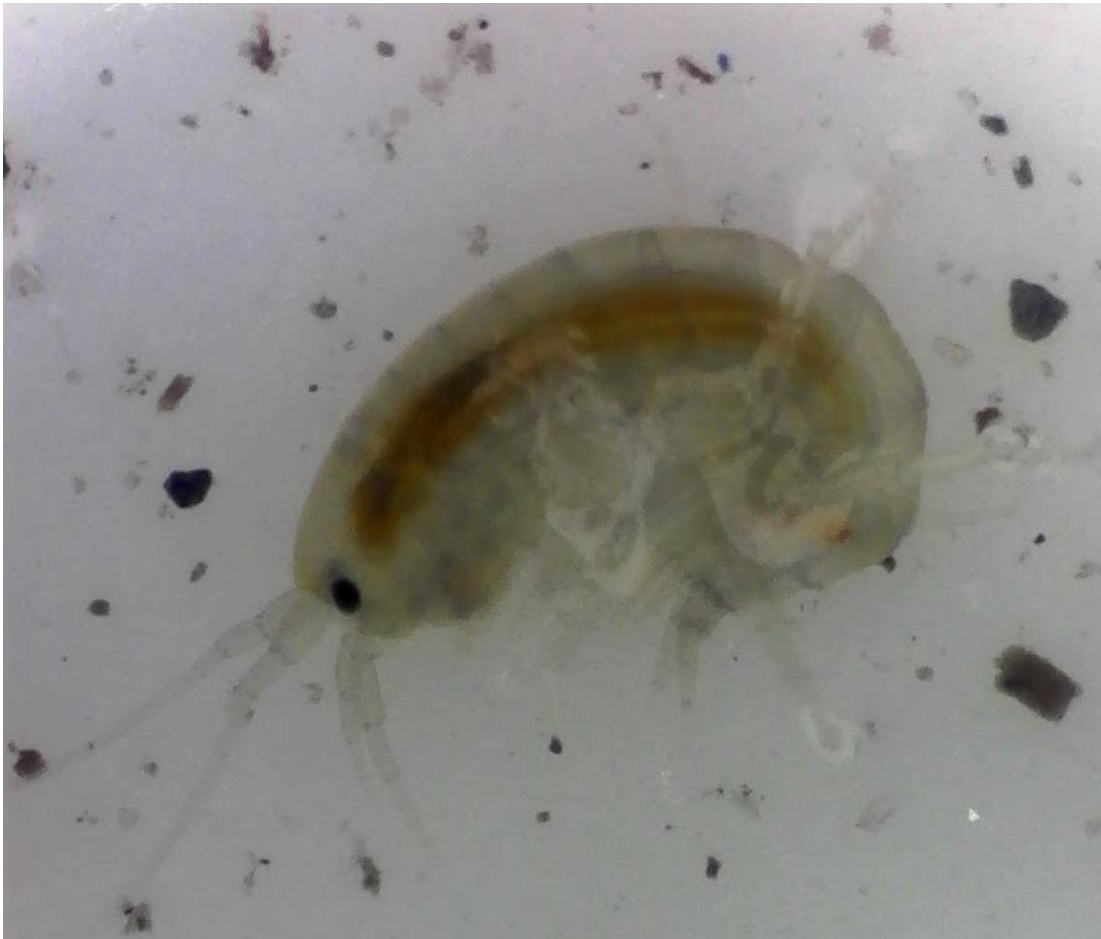
Photo d'un amphipode prélevé dans la roubine qui jouxte l'école grâce à un filet à plancton et observé au microscope le vendredi 23 février à 15h00.