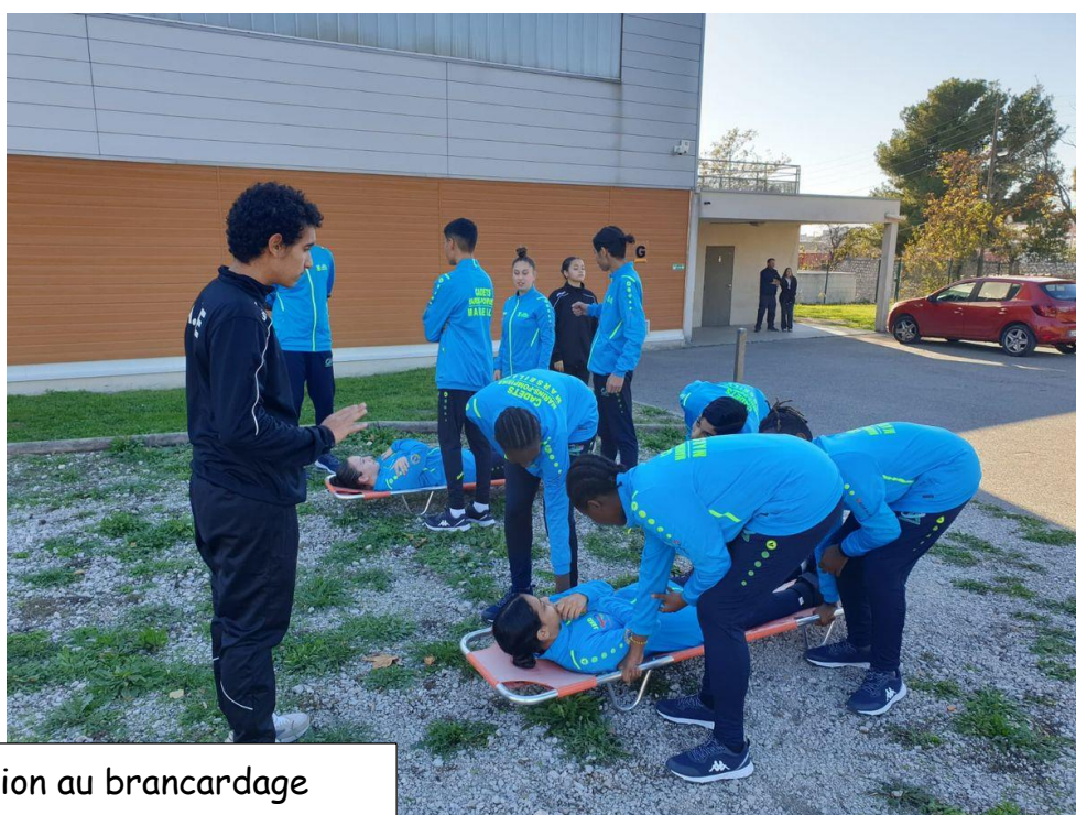
Initiation au brancardage