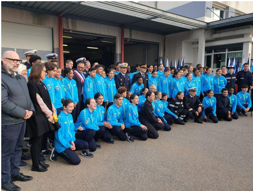
Photographie officielle et mise à l'honneur des cadets du collège Henri Wallon avec la présence de l'adjoint au maire, du Premier Maître et autres encadrants du Bataillon des Marins Pompiers ainsi que du chef d'établissement, du CPE et de l'Assistance sociale.