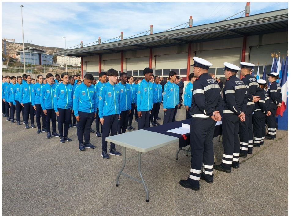
Avancée du groupe en ordre serré pour signer la charte