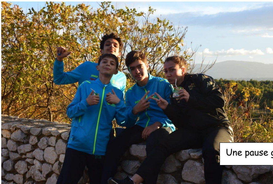
Une pause goûter bien méritée

Enfin, le dernier mercredi de décembre, les cadets se sont rendus au Parc Pastré pour une séance de cohésion de groupe.