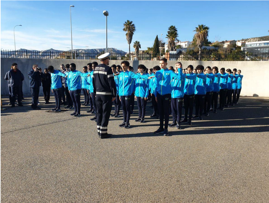
Formation du groupe ou « toit »

Mercredi 29 novembre, les cadets ont signé officiellement la Charte lors d'une cérémonie au CIS de Saumaty en présence des autorités militaires et civiles.