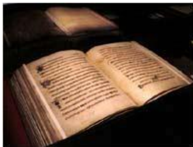
Les mystères du Book of Kells

C'est le plus beau manuscrit enluminé du monde, est aussi l'une de nos plus belles énigmes. Il est aujourd'hui exposé au Trinity College, une université, à Dublin, la capitale de la république d'Irlande. Et grâce à une superbe reproduction (fac-similé), chercheurs et étudiants de l'Université du Texas et du Collège Austin peuvent l'étudier page par page à la recherche de nouvelles réponses.