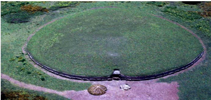
Vue aérienne de Newgrange.

Saint Colomba d'Iona (521-597) est un irlandais qui participa à l'évangélisation de l'Irlande, de l'Écosse et du Nord de l'Angleterre. Considéré comme l'un des saints patrons des irlandais, Saint Colomba mena tout au long de sa vie un combat en faveur de la conversion complète de peuples n'ayant pas encore été évangélisés par le christianisme en Irlande, en Écosse et en Angleterre.