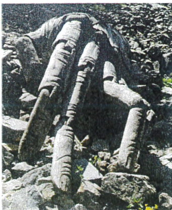
Mano a Mano, 2018 Pedro Marzorati