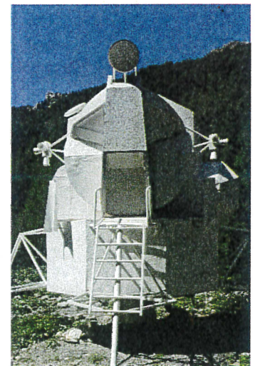
Lunar Shelter, 2020 Olivier Thomas