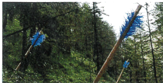
Jeux d'enfants / Flèches, 2017 Pedro Marzorati