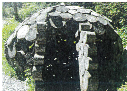
Maurizio Perron The Last Refuge, 2018