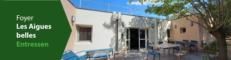
Foyer Les Aigues belles Entressen