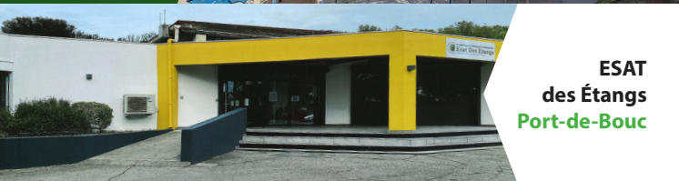
ESAT des Étangs Port-de-Bouc