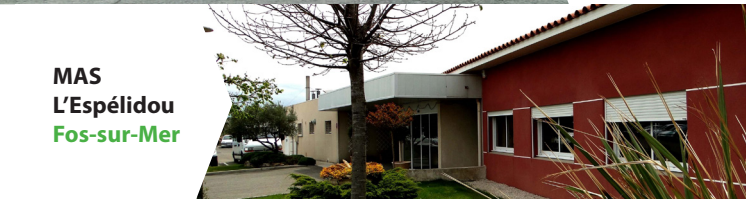
MAS L'Espéidou Fos-sur-Mer