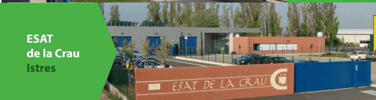
ESAT de la Crau Istres