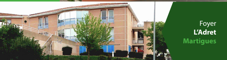
Foyer L'Adret Martigues