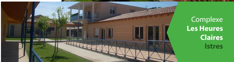
Complexe Les Heures Claires Istres