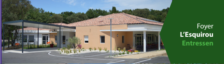
Foyer L'Esquirou Entressen