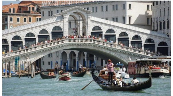
Il ponte di Rialto

13 Après le café je suis la boisson préférée des italiens au petit déjeuner.