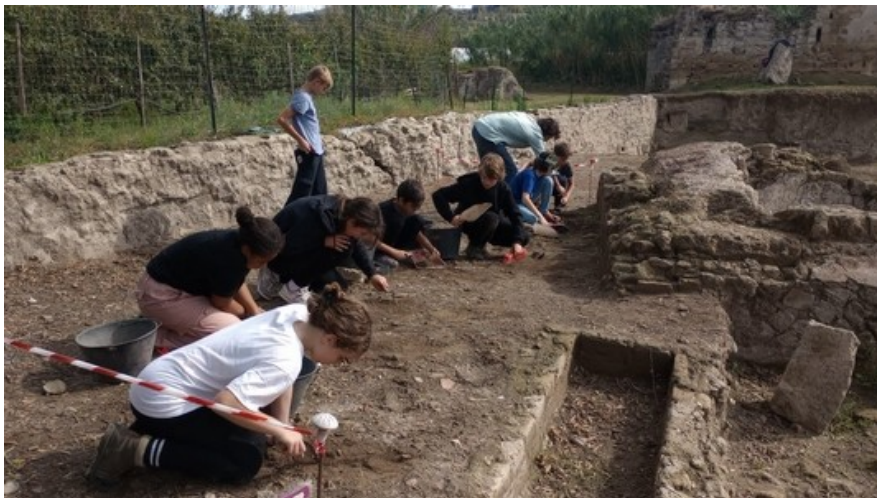
Atelier fouilles, 19 octobre 2023, Centre archéologique de Cumés, Italie

En octobre 2023, la section « italien » de la classe de 5°4 est partie à Naples en voyage d'études d'archéologie. Nous vous présentons les ateliers réalisés par les élèves avec les archéologues locaux du Centre Jean Bérard de Naples