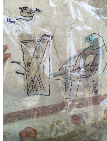
Photo du travail réalisé, 19 octobre 2023, Centre archéologique de Cumes