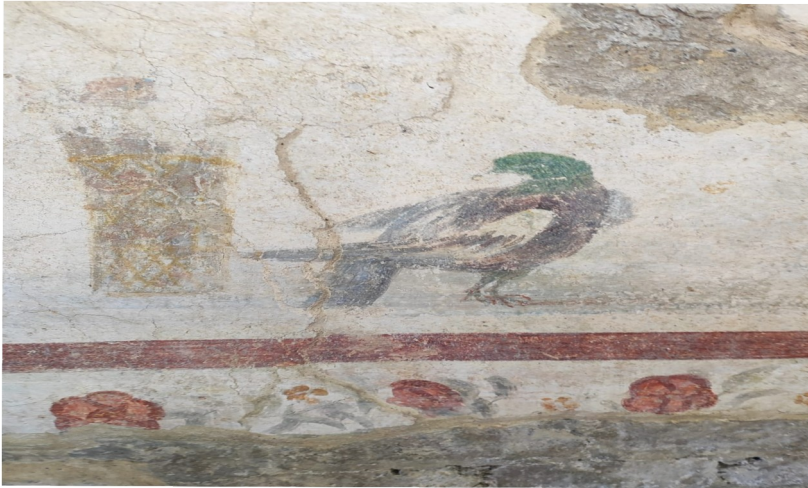
Photo de la fresque, 19 octobre 2023, Centre archéologique de Cumes