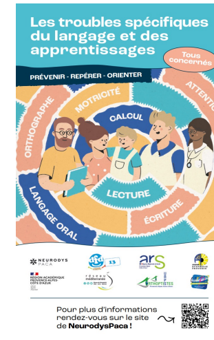
Guide d'aide au repérage, à la prévention et à la prise en charge des TSLA