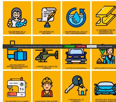
Des secteurs, des filières, des métiers

En 5 ème j'approfondis mes connaissances sur les secteurs professionnels, notamment ceux du développement durable, et je découvre les métiers associés.