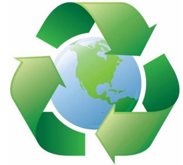
Quizz: les métiers du développement durable