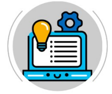
Moteurs de recherche des établissements et des formations