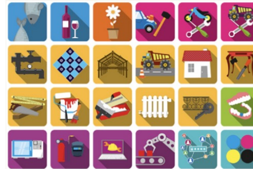
Les métiers animés