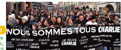
3 Manifestation suite à l'attentat contre les journalistes de Charlie Hebdo, Strasbourg, janvier 2015