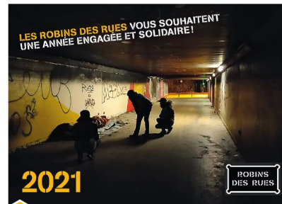
1 Carte de vœu de "Robins des rues" Robins des rues est une association qui organise des maraudes et accompagne des sans-abri à Paris.

Pour chaque image, précisez quelles sont les valeurs défendues et par qui.