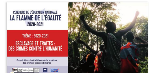
2 Affiche du concours « La flamme de l'égalité »