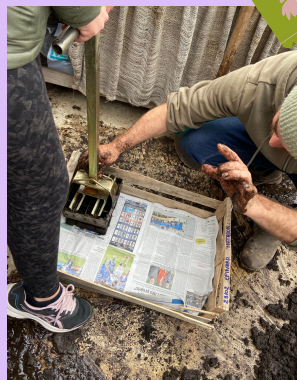
Utilisation du « presse-mottes»