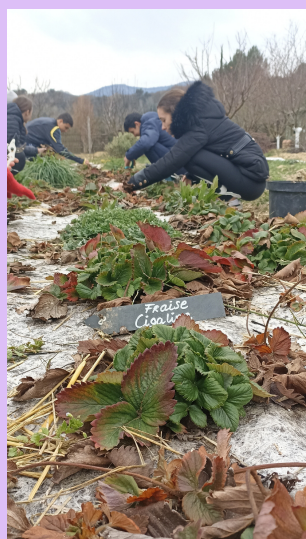
Désherbage des fraises

Cette méthode est très pratique pour éviter d'acheter des graines.