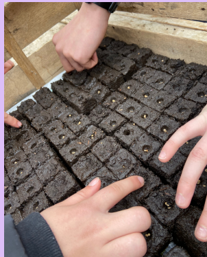
Graines d'épinards semées - Sarah