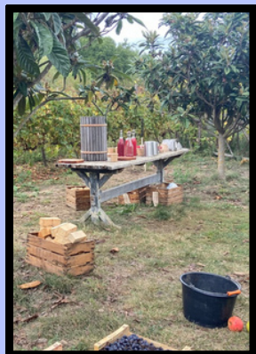
Le jus de raisin