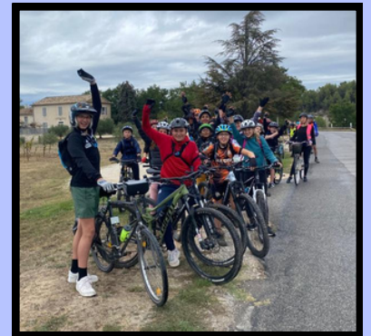
À vélo!