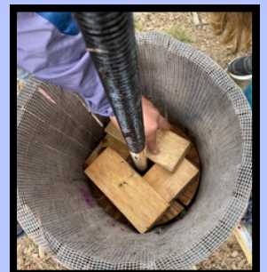
Le pressoir