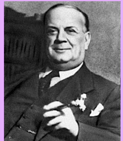
Guccio Gucci, 1940

Del resto, la marca Gucci si ispira all' equitazione.