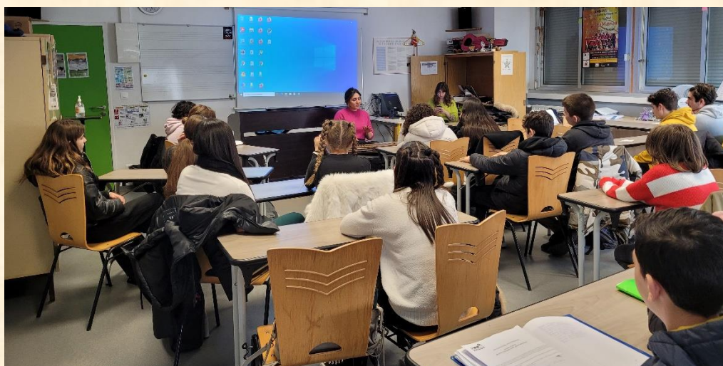
La classe très à l'écoute