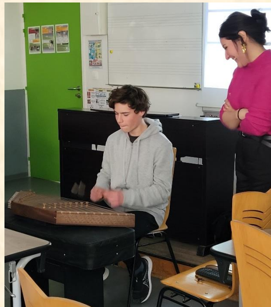
Essais de l'instrument

À la fin de la séance, quelques élèves ont essayé l'instrument et ce moment plus ludique a conclu dans la bonne humeur cette intervention qui a été très appréciée par tous. Rendez-vous a été d'ores et déjà pris pour une nouvelle participation du collège l'année prochaine.