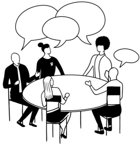
Table ronde de l'orientation Entretien personnalisé

La famille et l'élève PP – Psy-en – Direction – REI (EBEP)