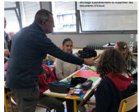
stockage supplémentaire ou supprimer des documents d'iCloud.