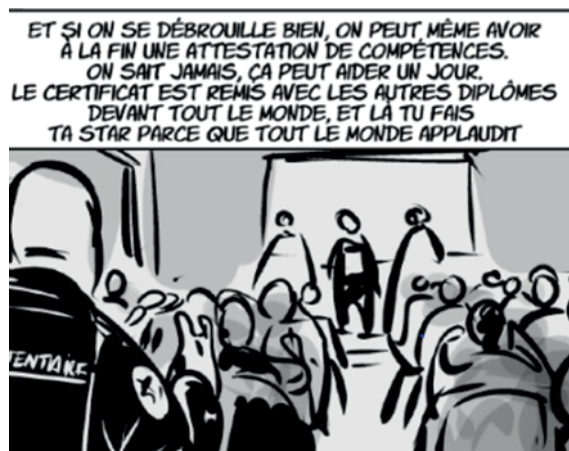
EPM DE MARSEILLE

Situation scolaire à l'incarcération à l'EPM 2021/2022 : 22% des mineurs n'ont jamais été scolarisés en France 33% des mineurs sont déscolarisés depuis plus d'un an 37% des mineurs sont déscolarisés depuis plus de deux ans 10% des mineurs sont déscolarisés depuis moins d'un an 16% des mineurs sont scolarisés avant incarcération L'âge moyen est de 16 ans. Les mineurs restent hébergés environ 106 j à l'EPM 40 maintiens de scolarité ont été réalisés pour les mineurs scolarisés à l'arrivée. 35 demandes de rescolarisation ont été conduites avec réorientation ou reprise de scolarité effectives.