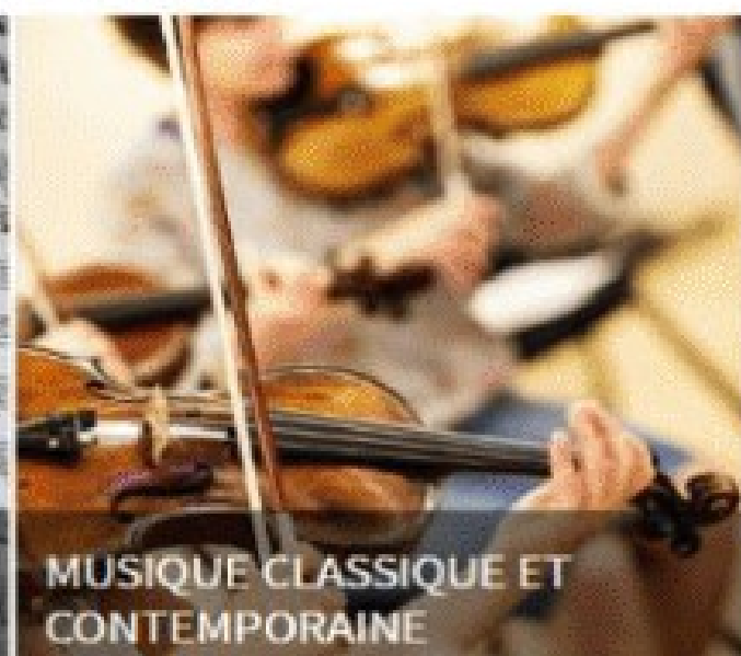
MUSIQUE CLASSIQUE ET CONTEMPORAINE