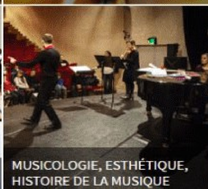
MUSICOLOGIE, ESTHÉTIQUE, HISTOIRE DE LA MUSIQUE