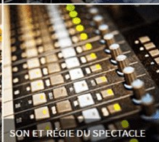
SON ET RÉGIE DU SPECTACLE