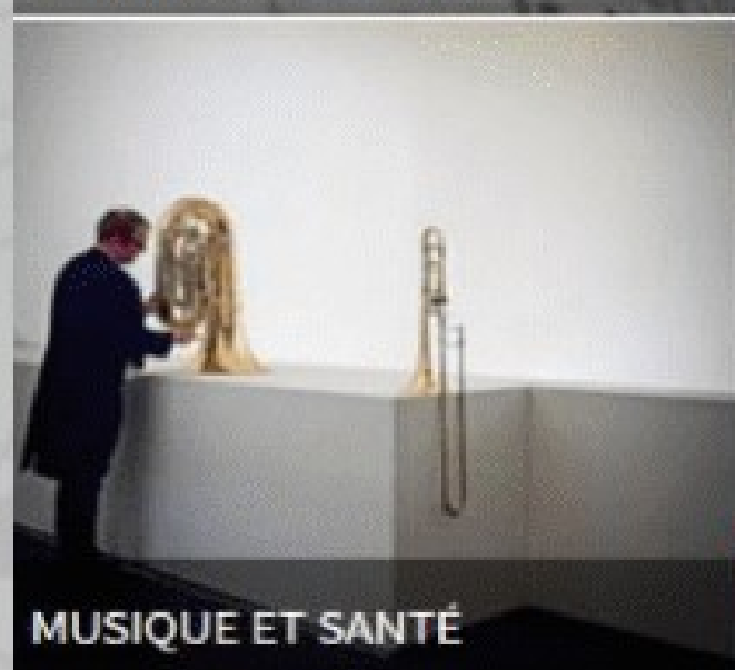
MUSIQUE ET SANTÉ