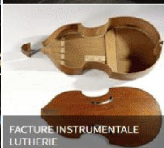
FACTURE INSTRUMENTALE LUTHERIE