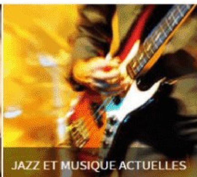
JAZZ ET MUSIQUE ACTUELLES