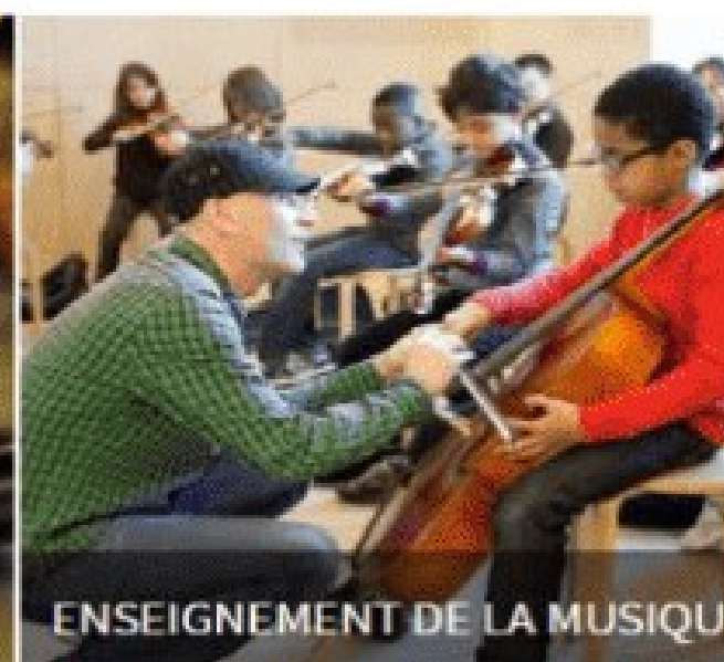
ENSEIGNEMENT DE LA MUSIQUE