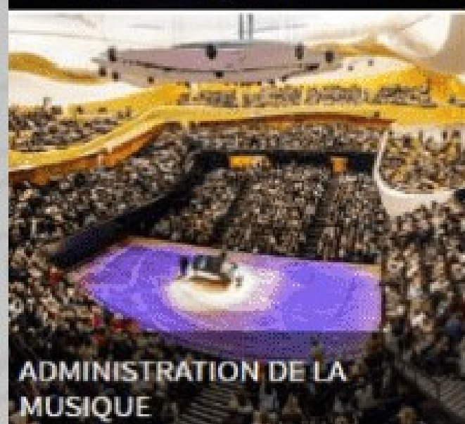
ADMINISTRATION DE LA MUSIQUE