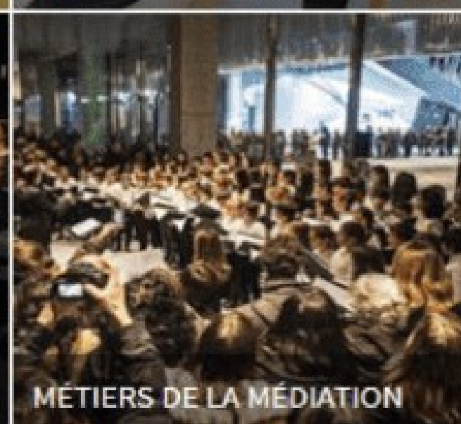
MÉTIERS DE LA MÉDIATION