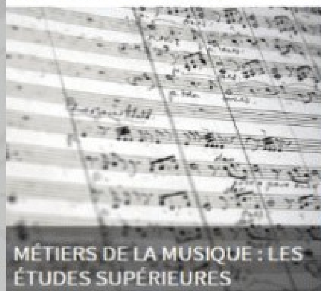
MÉTIERS DE LA MUSIQUE : LES ÉTUDES SUPÉRIEURES