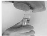
Enlever le bouchon jaune