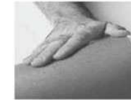
Puis massez la zone d'injection