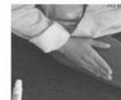
Masser légèrement le site d'injection