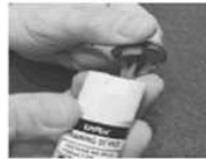
Enlever le capuchon bleu