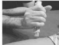
Placer l'extrémité orange du stylo sur la face extérieure de la cuisse