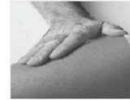
Puis massez la zone d'injection