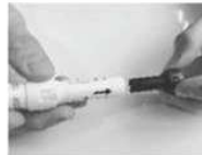
Enlever le capuchon noir protecteur de l'aiguille