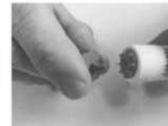
Retirer le bouchon noir protecteur