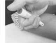
Appuyer fermement le stylo sur la face extérieure de la cuisse