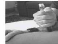
Appuyer fermement jusqu'à entendre un déclic en tenant la cuisse et maintenez appuyé pendant 10 sec.