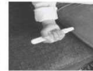
Placer et appuyer le stylo contre la face externe de la cuisse. Maintenir le stylo contre la cuisse pendant environ 5 secondes