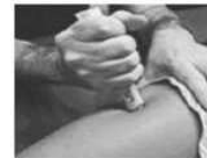
Appuyer fermement la pointe orange dans la cuisse jusqu'à entendre un déclic et maintenez appuyé pendant 10 sec.