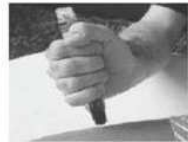
Placer l'extrémité noire du stylo sur la face extérieure de la cuisse