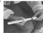
Enlever le capuchon protecteur de l'aiguille