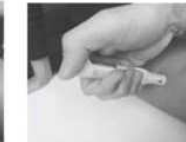
Puis appuyer sur le bouchon rouge de déclenchement et maintenez appuyé pendant 10 sec. Puis masser la zone d'injection