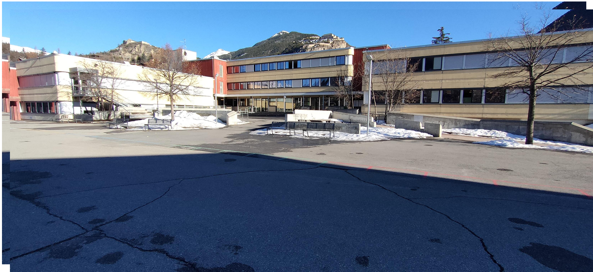
Collège Les Garcins – Briançon Présentation de la 3 e Prépa-Métiers