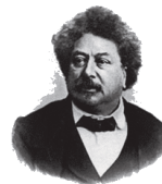
Collège Alexandre DUMAS

Site internet : www.clg-dumas-marseille.ac-aix-marseille.fr