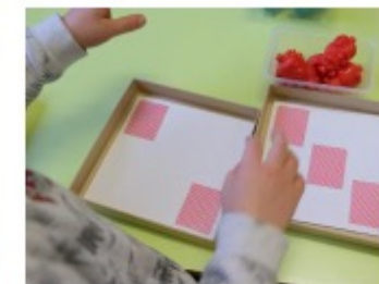
La validation est effectuée en plaçant un ourson sur chaque lit.