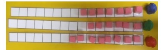
Figure 4 : Comparer des quantités sans dénombrer