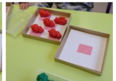
Les erreurs donnent l'occasion de découvrir des décompositions : « 6 c'est 5 et encore 1 » et « 5 c'est 1 de moins que 6 » ;