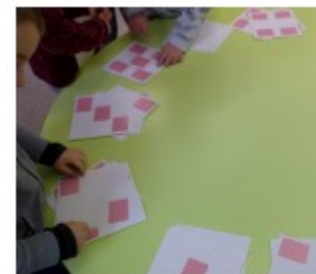
Aller chercher deux cartes pour avoir juste ce qu'il faut de lits pour les oursons.