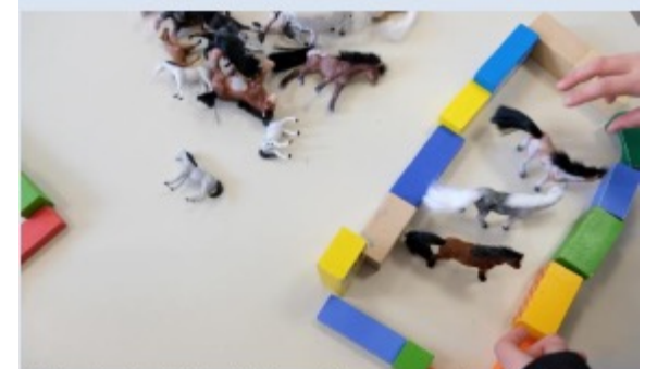
Réalisation de l'action décrite par l'énoncé avec le matériel

Résolution : par comptage, surcomptage/décomptage sur les doigts ou par utilisation de faits numériques connus → Procédures à institutionnaliser et à entraîner