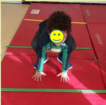
I jump like a frog.